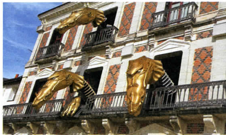
A la Maison de la magie, à Blois, une hydre à six têtes surprend toujours les visiteurs toutes les heures en saison.

On peut partir à la découverte du Val de Loire et de ses châteaux à vélo. Au total, 300 km de voies balisées et sécurisées pour se rendre de Blois à Chambord, un château érigé au cœur d'un domaine, aussi vaste que Paris intra-muros ! Avec ses 156 m de façades, ses quatre cent quarante pièces et son escalier à double révolution conçu par Léonard de Vinci, Chambord est un chef-d'œuvre de la Renaissance française. Construit sous François I er ,