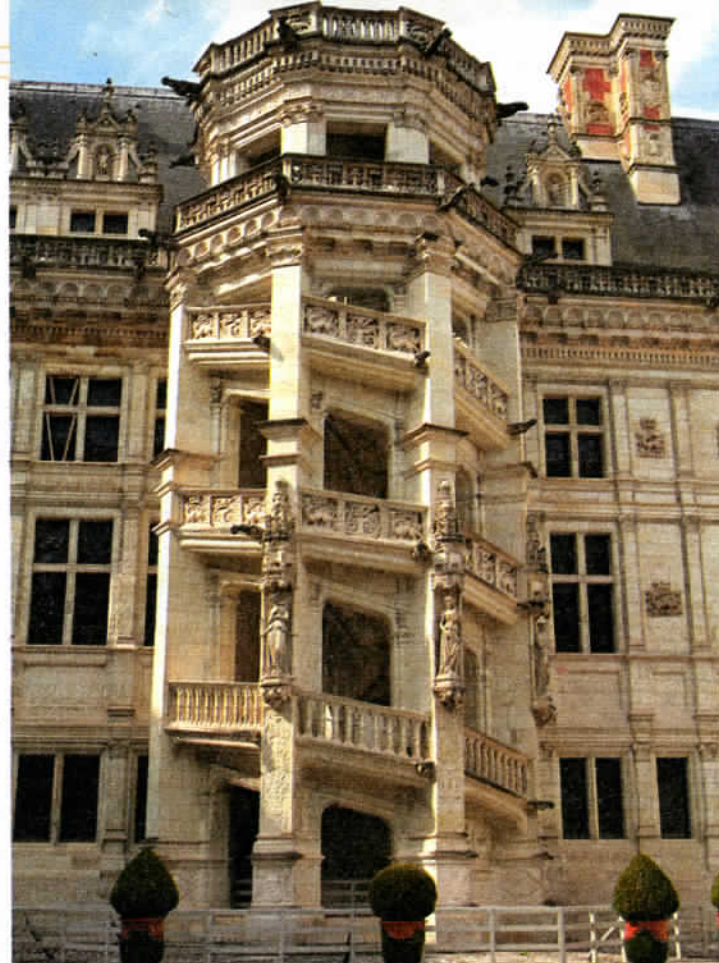
La cage évidée de l'escalier du château de Blois forme une série de tribunes d'où la cour assistait à l'arrivée des grands personnages.

Enfin, sur l'autre rive de la Loire, à Chouzy-sur-Cisse, le domaine de La Pépinière offre une gamme de loisirs attractive (du tir à l'arc sur cible en mousse 3D à l'initiation au quad). Et le meilleur pour la fin : un baptême de l'air en ULM, avec le survol des châteaux de la Loire... Avis aux amateurs de la Terre vue du ciel. ■